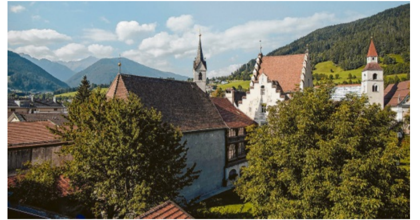
Blick über die Altstadt mit ihren markanten Kirchtürmen – dahinter die grünen Hänge der Alpen.