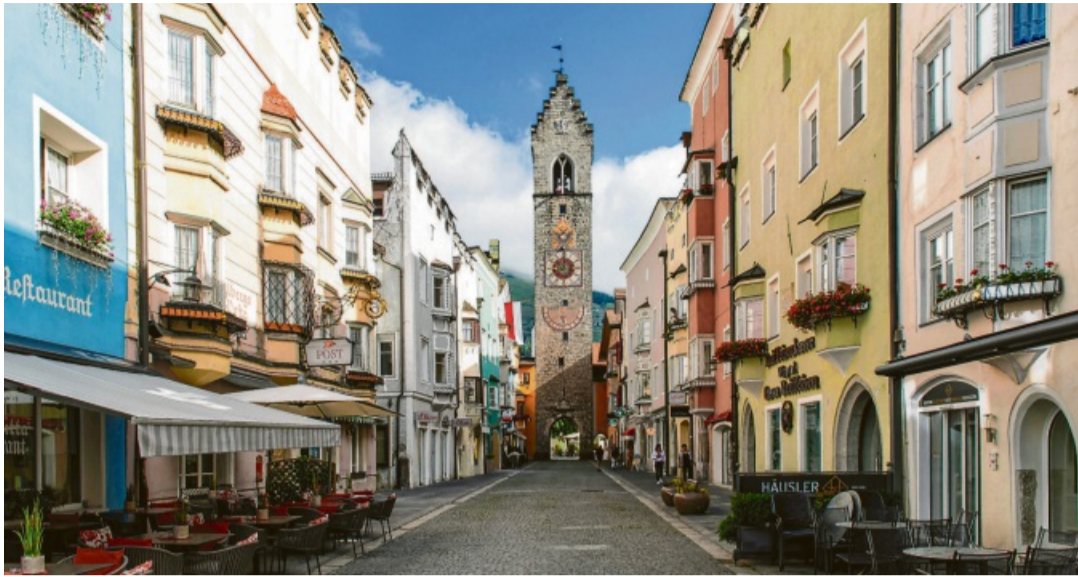
Blick durch die Sterzinger Altstadt: In der Fußgängerzone führt die Einkaufsstraße direkt auf den markanten Zwölferturm zu.