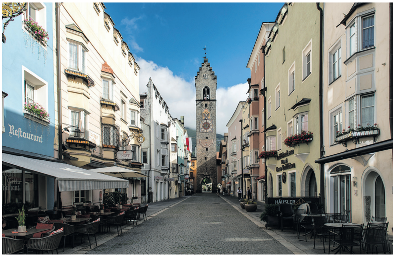
Blick durch die Sterzinger Altstadt: In der Fußgängerzone führt die Einkaufsstraße direkt auf den markanten Zwölferturm zu.