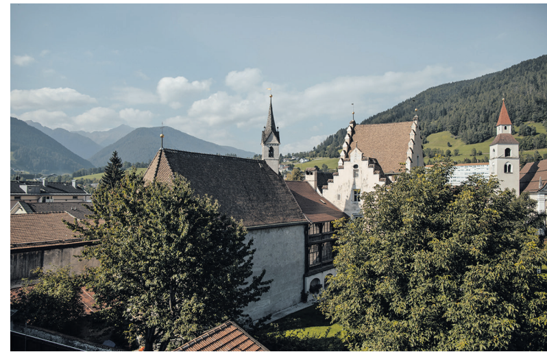
Blick über die Altstadt mit ihren markanten Kirchtürmen – dahinter die grünen Hänge der Alpen.