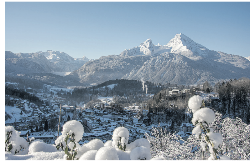
Lockstein im Winter: Der Aussichtspunkt zeigt sich verschneit und eröffnet einen eindrucksvollen Blick über Berchtesgaden und die umliegende Bergwelt.