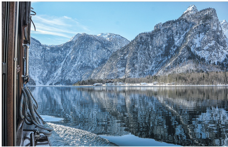
Königssee im Winter: Stille Bergwelt, kristallklare Luft und ein See, der selbst in der Kälte magisch schimmert.