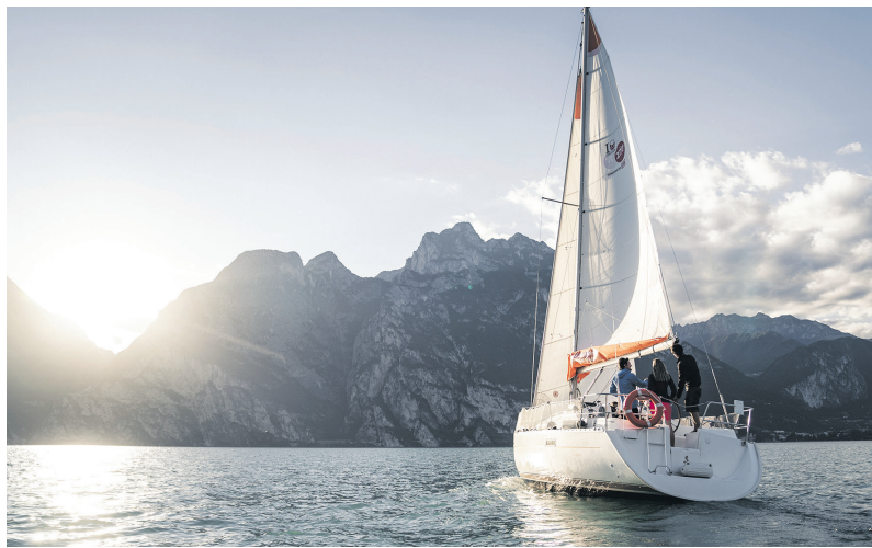
Ein sonniger Tag auf dem malerischen Ledrosee, umgeben von den imposanten Gipfeln der Gardasee-Berge – pure Entspannung und Naturgenuss.

schenkt eine Extraportion Urlaubsstimmung. Das Klima ist mild und die himmlischen Ausblicke über das Wasser machen nie müde, noch ein Foto zu schießen. Besonders geeignet ist der Ledrosee für eine einfache Rundwanderung. In gut drei Stunden lassen sich die etwa 13 Kilometer um den See zurücklegen. Wer die zahlreichen Einkehrmöglichkeiten nutzt und auch hin und wieder einen Sprung ins kühle Nass wagt, wird allerdings viel länger brauchen. Die Wege sind super ausgeschildert und abwechslungsreich. Mal geht es an der Uferpromenade entlang, dann über Waldwege. Und die Dörfer am See sind es wert, erkundet zu werden.