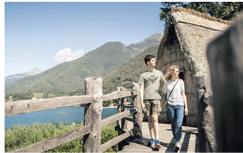
Ein Spaziergang durch die Pfahlbauten am Ledrosee – eine Zeitreise in die Vergangenheit inmitten einer atemberaubenden Naturkulisse.

1929 wurden am Südufer des Sees während der Bauarbeiten für das Wasserkraftwerk in Riva del Garda 10.000 Pfähle entdeckt. Es waren die Reste einer der größten, bedeutendsten und am besten erhaltenen Pfahlbausiedlungen Europas. Seit 2011 ist die archäologische Stätte Weltkulturerbe der UNESCO. Die Rekonstruktion des primitiven Dorfs, das zwischen 2200 und 1350 v. Chr. hier stand, ist absolut faszinierend, nicht nur für Kinder. Daneben bietet das Museumszentrum tiefere Einblicke in die archäologischen Fundstücke. Events, Konzerte und Workshops